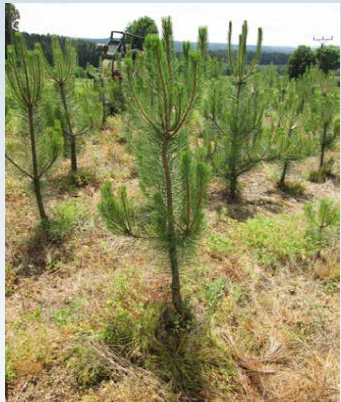
Hurtigtvoksende østrisk fyr som endnu ikke er helt klar til salg.

Forskellige andre problematikker fra enkelte lande blev drøftet på mødet. Herunder blev dato og sted fastsat for kommende møder i 2015. Danmark har aftjent sin pligt som formandsland, og hvis alt går som planlagt, vil give jobbet blive givet videre i 2015. Hvilket land, som påtager sig formandsopgaven, er ikke afgjort endnu.