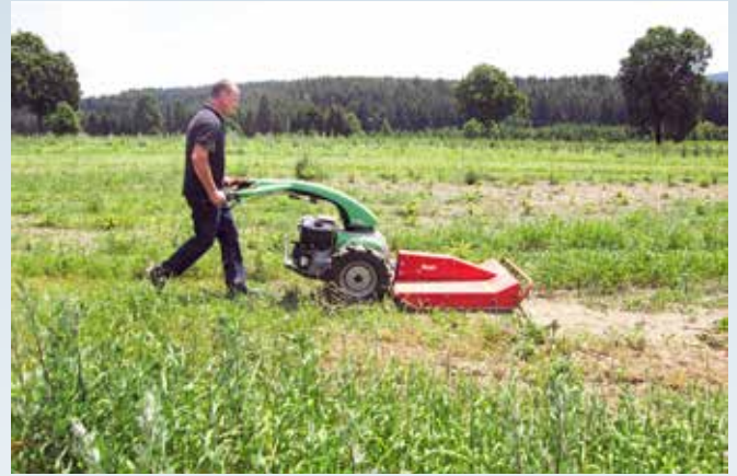
Demonstration af en hånddreven slåmaskine, som kan bruges mellem rækker, i vejkanter og andet.