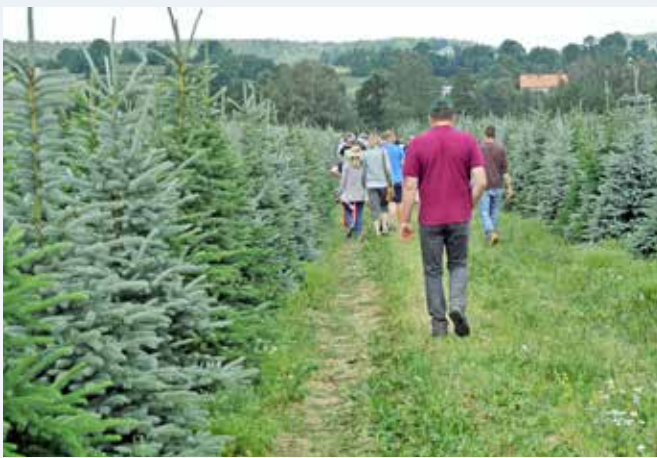
Forskellige provenienser af blågran klar til salg i den kommende sæson.