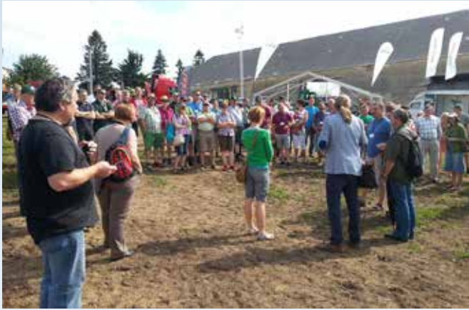
Den arrangerede udstilling mindede på mange måder mindede om en formiddagsudstilling forud for Danske Juletræers markvandring, men meget mindre.