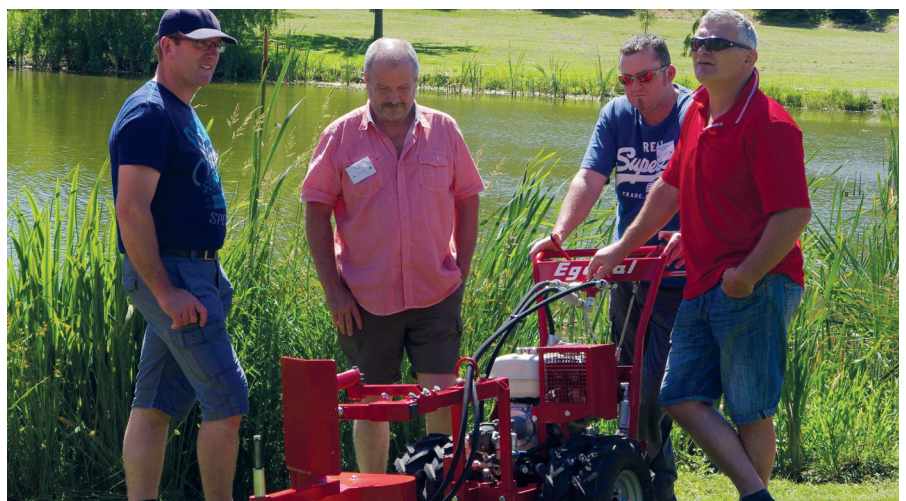
Die schweizer Kollegen zeigten sich sehr an der Technik von Egedal interessiert. Der Maschinenhersteller zählte auf der kleinen Messe bei der Firma Jutek zu den Ausstellern.