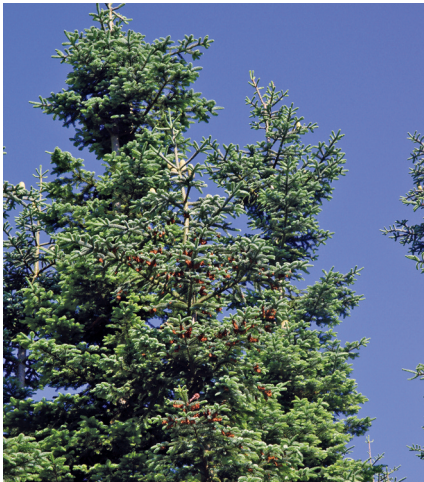
Die Nobilis auf Langesø: Viele Zapfen bedeuten schlechte Reisigqualität.

Pflicht. Jørgen Kæhlershøj gegründet im Jahr 1997 das Unternehmen mit dem Ziel, Maschinen für die Weihnachtsbaumproduktion, für Baumschulen und für Beeren- und Obstplantagen zu produzieren. Heute sind 25 Mitarbeiter beschäftigt und fast wöchentlich verlässt ein Gerät die Firma zu einem Produzenten. Das Besondere: Die Firma ist spezialisiert auf individuelle Spezialtraktoren, maßgeschneidert auf den jeweiligen Betrieb. Die Preise schwanken zwischen 11.000 Euro für einen Kleintraktor bis zu über 120.000 Euro für einen 100 PS-Portaltraktor.